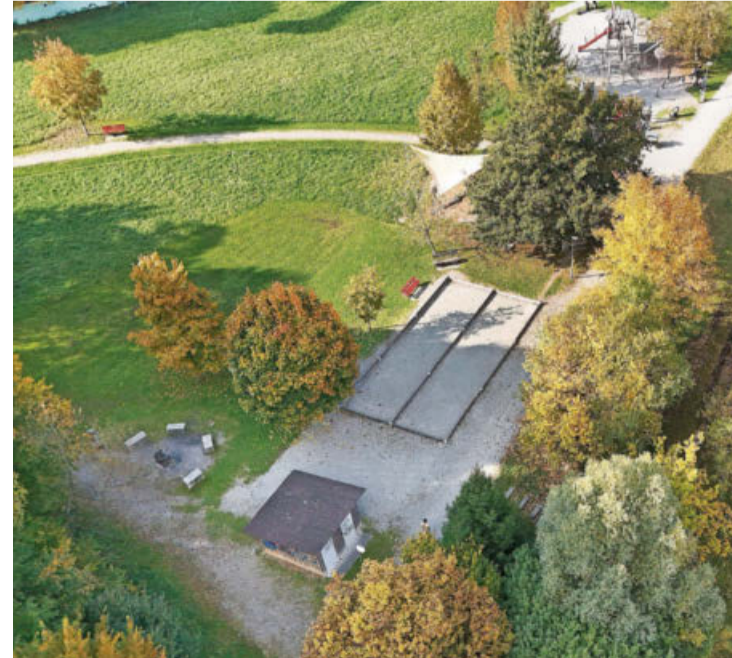
Mit generationenübergreifender Funktion: Das Moosburg-Areal soll künftig noch mehr Leute zum Verweilen einladen.

Zusätzlich soll das Areal mit einem neuen Verbindungsweg an den Krokusweg und die Neuüberbauung an der Rütlistrasse angeschlossen werden. Dafür bewilligte der Stadtrat gebundene Ausgaben von 56 000 Franken. Die Finanzierung erfolgt über den Mehrwertausgleich aus dem Gestaltungsplan Rütlistrasse. Die Bauarbeiten sind für den kommenden Herbst vorgesehen.